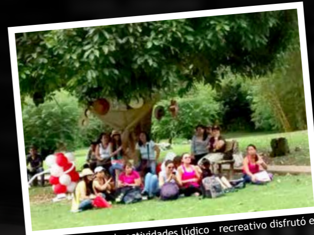
Un día completo de actividades lúdico - recreativo disfrutó el personal administrativo de la Institución.