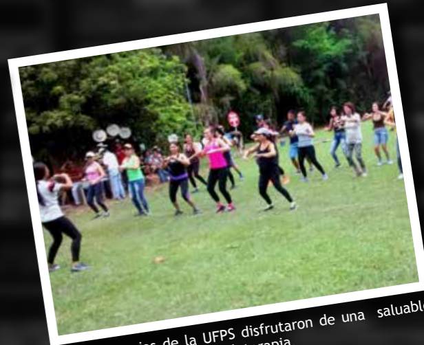
Las Secretarías de la UFPS disfrutaron de una saludable jornada de aeróbicos y bailoterapia.