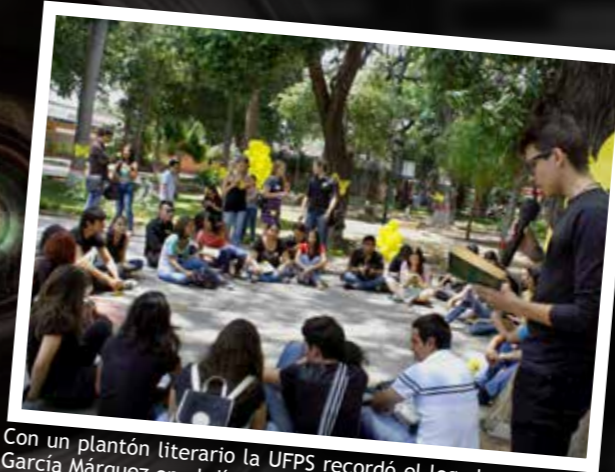
Con un plantón literario la UFPS recordó el legado de Gabriel García Márquez en el día del Libro y del Idioma.