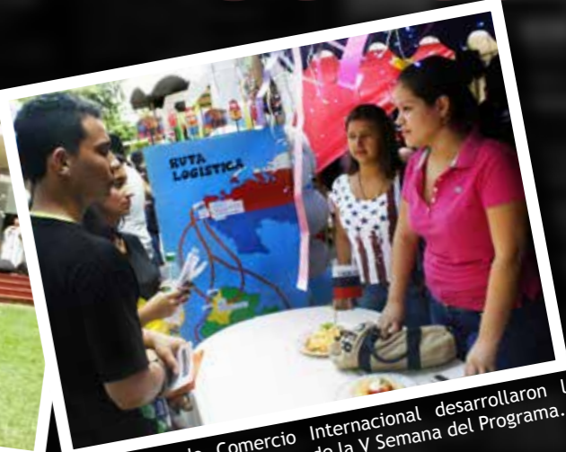
Estudiantes de Comercio Internacional desarrollaron la Feria de Países en el marco de la V Semana del Programa.