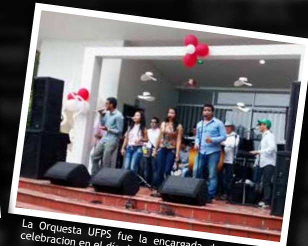
La Orquesta UFPS fue la encargada de amenizar la celebración en el día de la Secretaría.